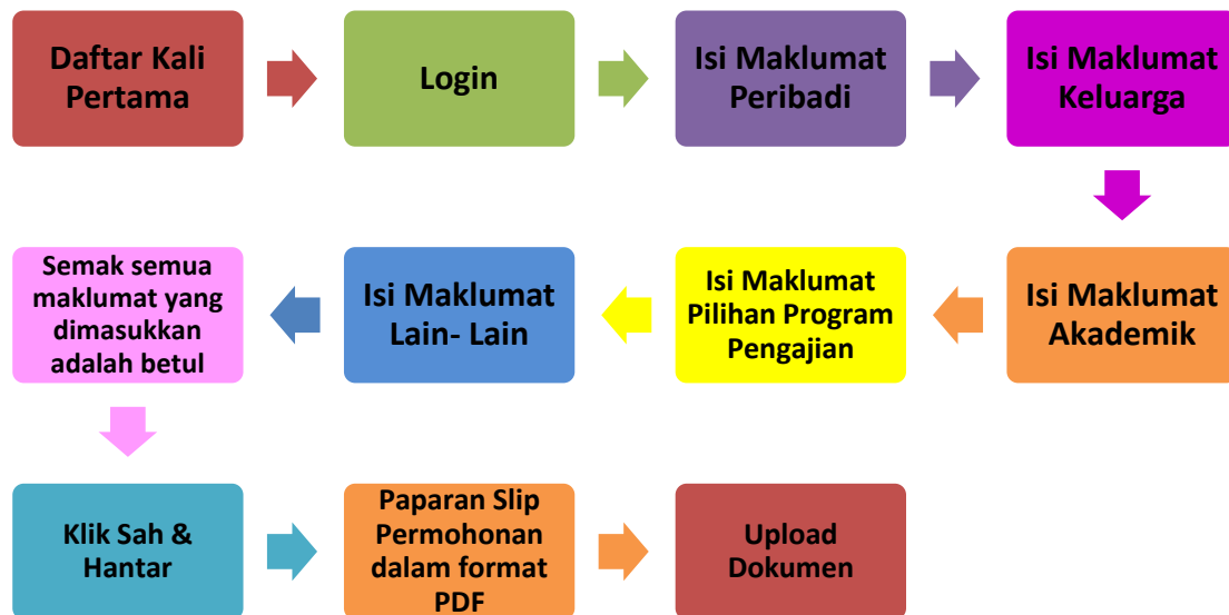
Rajah 1 - Carta Alir Permohonan UPUOnline