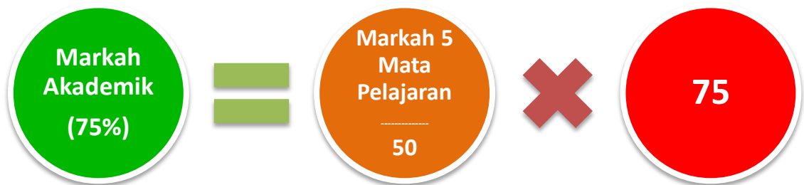
Rajah 2 - Pengiraan Markah Akademik (75%)