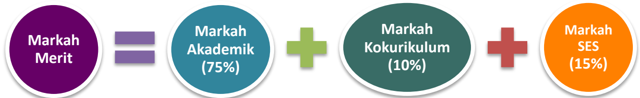
Rajah 3 - Pengiraan Markah Merit