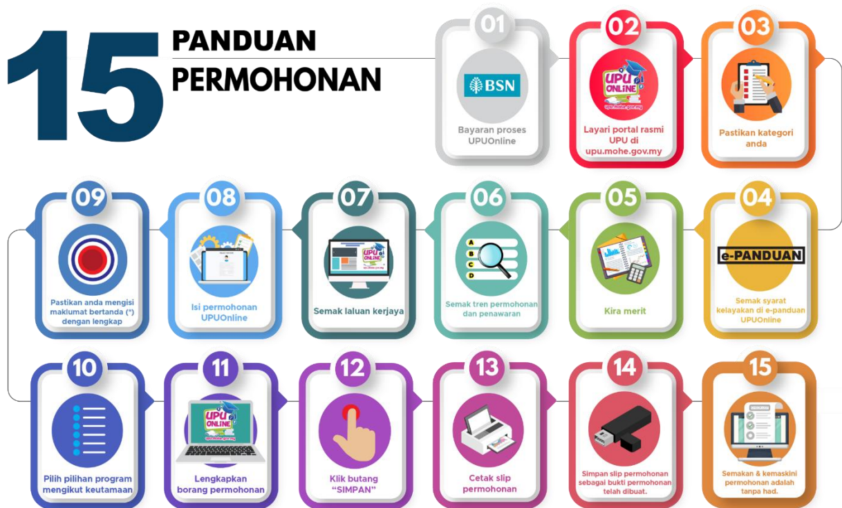
Gambar rajah 1 : Panduan Permohonan Sesi Akademik 2025/2026

4.3 Calon dinasihatkan membaca terlebih dahulu panduan dan syarat-syarat yang telah ditetapkan bagi mengelakkan calon memilih program yang tidak melepasi syarat khas program pengajian.